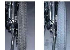
세정전 세정후 <우수한 세정력>