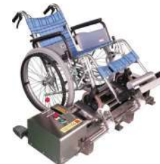
<RM-2에 휠체어를 올린 모습>