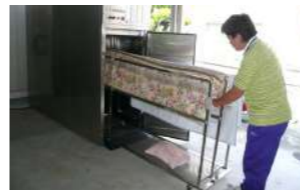
<대차를 사용하여 누구나 손쉽게>

소독고에 들어가는 대차가 포함되어 있어, 작업이 간단 합니다. 이불, 베개, 등 1인 분의 침구용품을 한번에 건조할 수 있습니다.