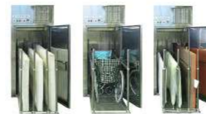
<동일 종류 또는 여러 종류를 혼합하여 동시 건조 가능>

휠체어, 매트리스, 이불, 담요 등 일반 건조기로는 건조 하기 어려운 다양한 제품을 빠른 시간 내에 건조할 수 있습니다.